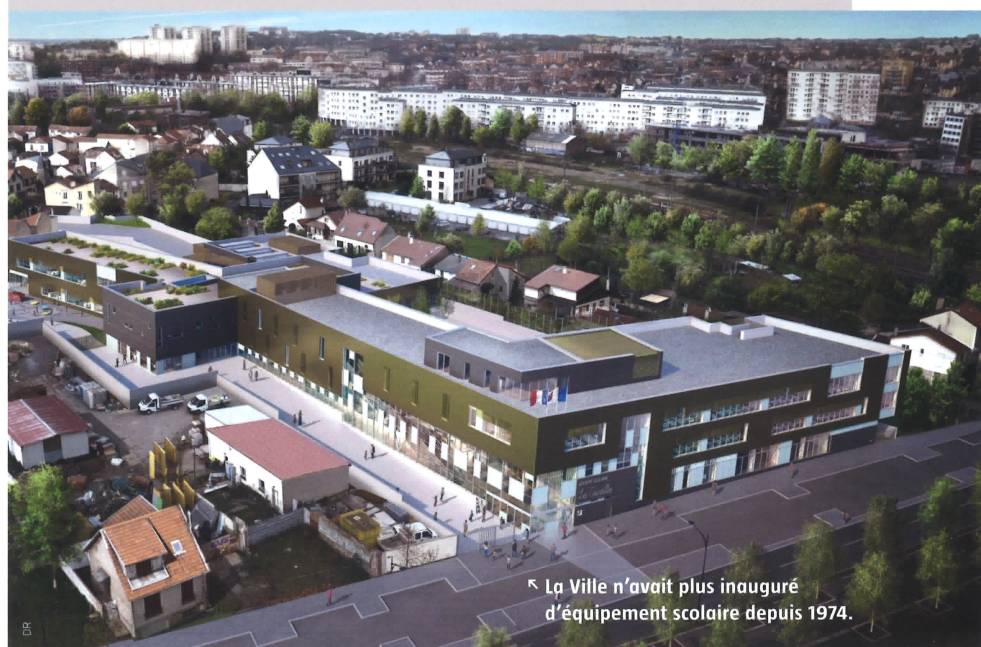
« La Ville n'avait plus inauguré d'équipement scolaire depuis 1974. »

Malgré les contraintes budgétaires rencontrées par les collectivités territoriales, Champigny a choisi de financer la construction de l'école sur ses fonds propres. « Nous avons cherché à réaliser des économies sans toucher à la qualité architecturale et à celle des prestations , précise Hervé D'Hollande. Le cahier des charges de la Ville prévoyait la plus grande exigence en matière de développement durable : réglementation thermique 2012, raccordement au réseau de géothermie, toitures végétalisées, optimisation pour l'entretien et la maintenance du bâtiment, etc. Le cabinet d'architectes lauréat devait aussi prévoir l'intégration du bâtiment à son environnement ». Bernard Valero, dirigeant du cabinet Valero-Gadan, en charge de l'opération, confirme : « il nous a été demandé de concevoir une école qui soit belle et qui valorise un quartier en devenir, tout en préservant son esprit pavillonnaire. Nous sommes des architectes fonctionnalistes, notre préoccupation principale était donc la pérennité et la réversibilité de l'ouvrage. Nous avons fait en sorte qu'il soit fonctionnel et qu'il puisse répondre à de nouveaux besoins, à l'avenir ». La livraison est prévue pour juin 2018.