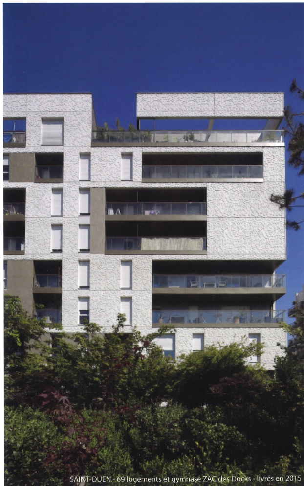
SAINT-OUEN - 69 logements et gymnase ZAC des Docks - livrés en 2015