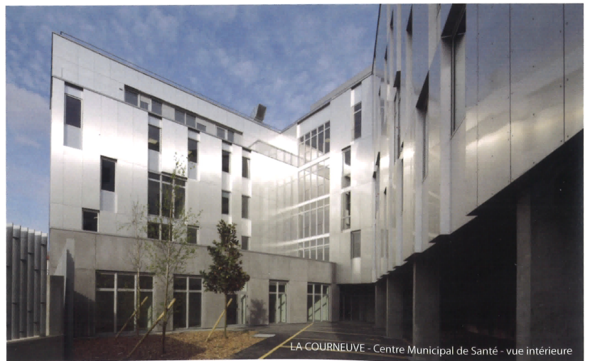
LA COURNEUVE - Centre Municipal de Santé - vue intérieure