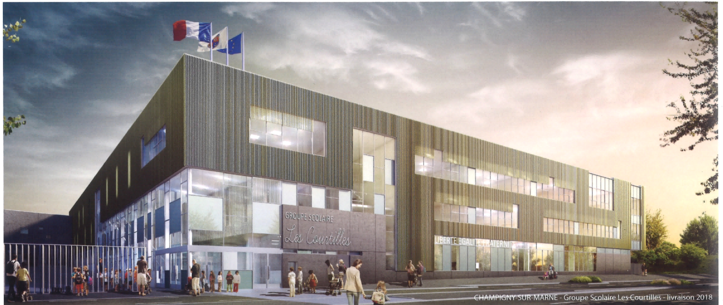
CHAMPIGNY-SUR-MARNE - Groupe Scolaire Les-Courtilles - livraison 2018

L'agence VGA réalise de nombreux bâtiments, dans un spectre de programmes aussi complexes que variés. Présents dans des domaines tels que l'hospitalier, le tertiaire, le sécuritaire, l'enseignement, la petite enfance, le logement, l'industrie, cette agence relève des défis souvent dans des contextes spécifiques. L'usage, la pratique du bâtiment et la générosité, combinés à la compréhension du contexte qui accueille le projet, sont les bases de l'architecture fluide et contemporaine de VGA. La structure de VGA est bâtie sur la réactivité et sur une organisation interne précise, qui vise à tracer le suivi des informations pour conserver la mémoire du projet, ses évolutions, du démarrage des études jusqu'à la livraison du chantier. C'est ce socle qui guide et réunit les trente salariés de l'agence, dont 8 directeurs de projets qui coordonnent le développement des études, pour les projets passés, en cours, et à venir.