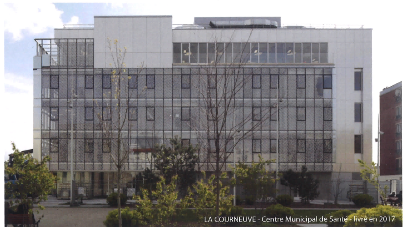
LA COURNEUVE - Centre Municipal de Santé - livré en 2017