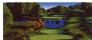
Golf 18 trous - Roissy (95) Architecte - Golf Optimum / Gilles Leverrier Maître d'Ouvrage - Communauté de communes Roissy Porte de France