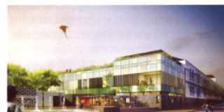
Ecole élémentaire Montesquieu - Vitry-sur-Seine (94) Architecte - Agence Valero-Gadan Maître d'Ouvrage - Ville de Vitry-sur-Seine