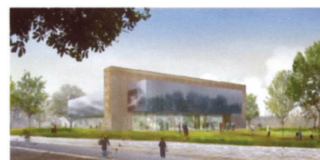
Gymnase « Les Poètes » - Pierrefitte-sur-Seine (93) Architecte - Agence Lehoux & Phily Maître d'Ouvrage - Ville de Pierrefitte-sur-Seine