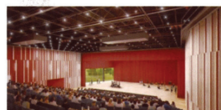
Cité des loisirs - Courbevoie (92) Architecte - Ateliers 2/3/4 Maître d'Ouvrage - Ville de Courbevoie