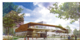
Ecole des Bateliers dans l'éco quartier des Dooks - Saint-Ouen (93) Architecte - Jean-François Laurent Maître d'Ouvrage - Sequano Aménagement