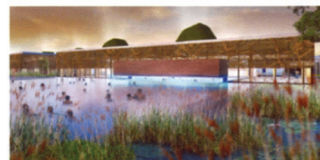
Centre aquatique écologique Montreuil (93) Architecte - Agence COSTE Architectures Maître d'Ouvrage - Ville de Montreuil

Troisièmement, nous voyons qu'il y a eu ce que rappelait Denis Monfleur, dans les années 60 et 70, la politique des villes nouvelles. Il s'agit d'inventer de la ville. Il s'agit de répondre à l'exode rural. Ce que le sociologue Henri Mandras appelait « La